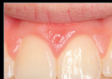
30 giorni post-intervento