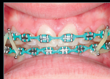
30 giorni post-intervento