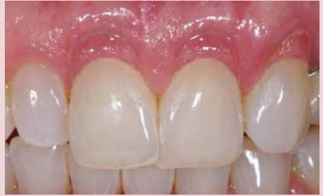
Caso clinico, prima e dopo il restauro con BEAUTIFIL II Gingiva Light Pink