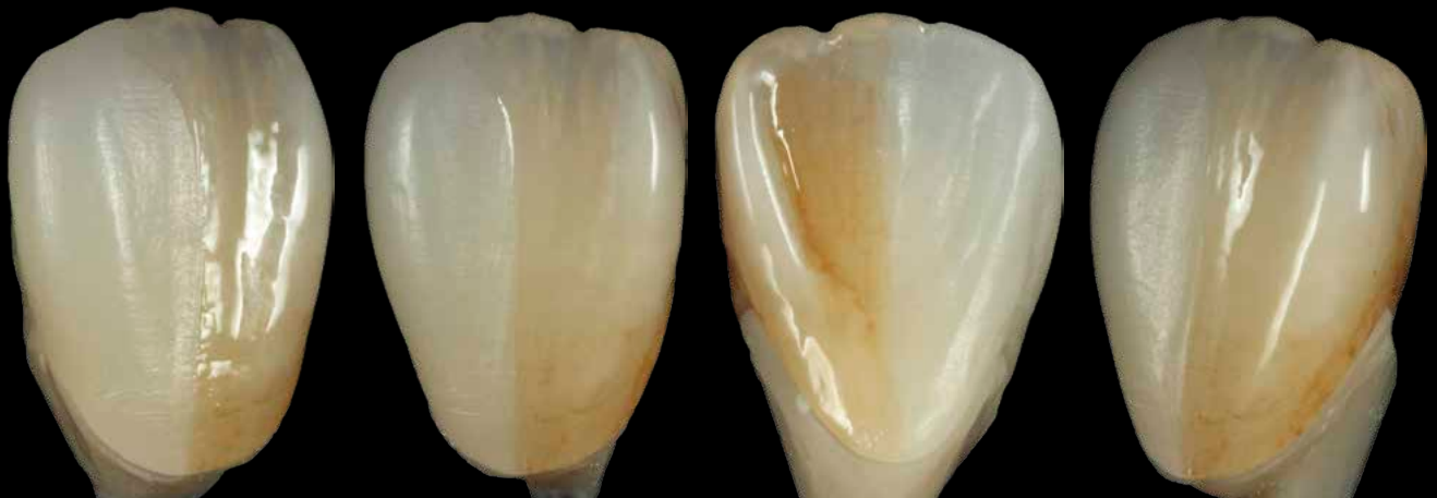
Restauri in zirconio monolitico pitturati e glasati, realizzati dal ceramista Tomoyuki Edakawa, Giappone

Vintage Art Universal può essere applicato in strati molto sottili e fornisce sia a tecnici principianti che a professionisti esperti un sistema semplice e completo: facile da usare, con risultati estetici eccellenti e con una gamma praticamente illimitata di possibilità creative.