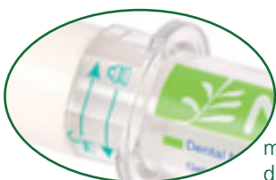
meccanismo di blocco