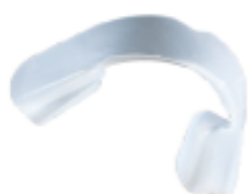
UltraFit prima dell'applicazione