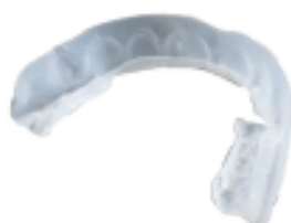
UltraFit dopo essere stata 10 minuti in bocca